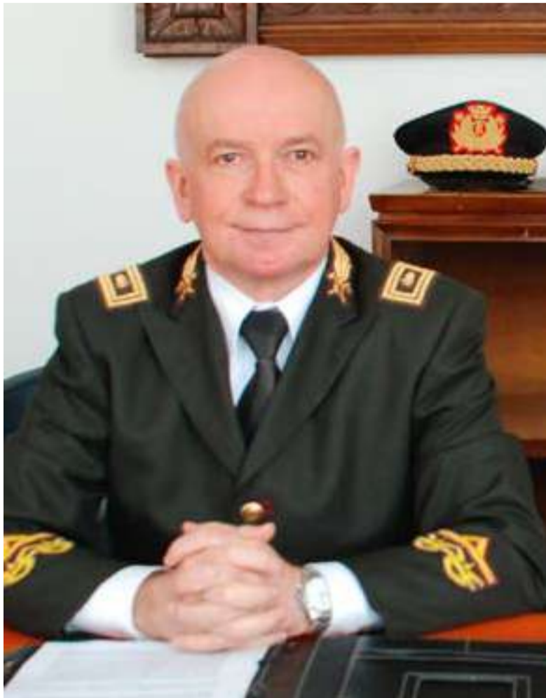
Fabrizio Piccinini, nuovo Comandante del Corpo dei Vigili del Fuoco di Milano

"Come ho avuto modo di dire, cerco sempre - per quanto possibile - di garantire il livello dell'offerta che mettiamo a disposizione della cittadinanza, che già qui a Milano è altissimo. Essenzialmente ci occupiamo di tre cose: una la gestione