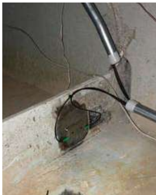
Estensimetri a fibra ottica che controllano le deformazioni a cui è soggetto l'impalcato del ponte.