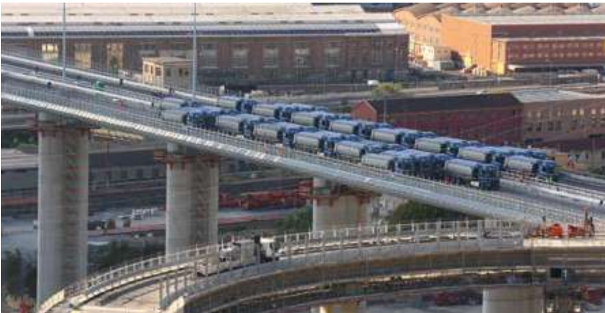
Veduta del ponte con i 54 tir da 44 tonnellate che hanno effettuato tra il 19 e 22 luglio il collaudo statico e dinamico del ponte.