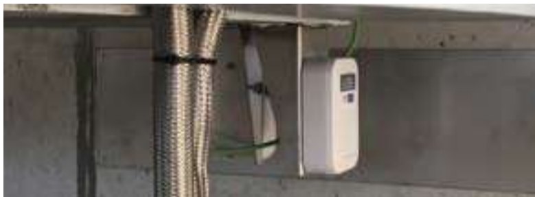
Sensori di spostamento a tecnologia radar per la misura dello spostamento relativo di ciascun piede metallico rispetto alla corrispondente pila.