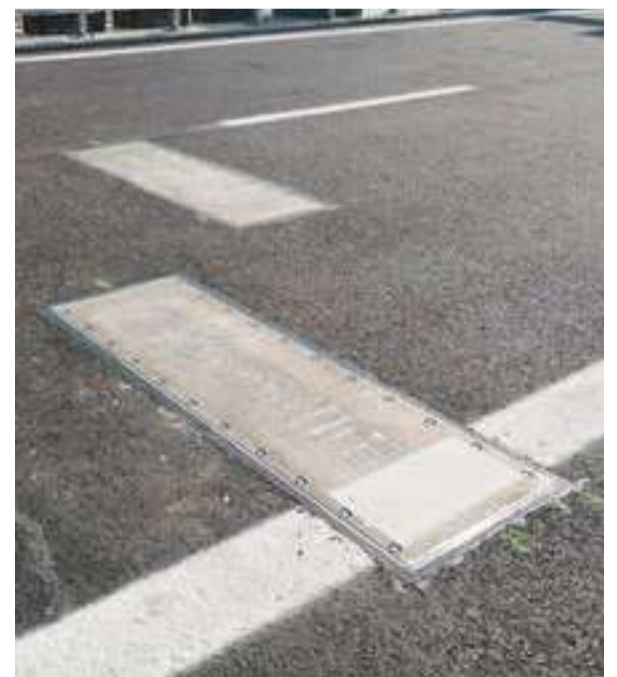
Sistema iWIM Bisonte annegato su ciascuna corsia della carreggiata est per l'individuazione dei veicoli in transito con un carico superiore al consentito.

ca, larghe 1.5 m, dotate di celle di carico a fibra ottica Weight in motion e annegate nell'asfalto, consente di misurare numero, tipologia, velocità, peso e targa di ogni veicolo in transito su ciascuna corsia delle carreggiate est e ovest e individuare i veicoli in transito con un carico superiore al consentito". Sarà così possibile conoscere in tempo reale il carico presente sul ponte e quindi le forze in gioco: "Questo sistema consente di conoscere la situazione complessiva del ponte in termini di carichi, permettendo così di analizzare non solo le informazioni provenienti dagli altri sensori (e quindi la risposta della struttura), ma anche le condizioni al contorno della stessa al fine di confrontarne il comportamento con i dati di progetto riferiti a condizioni analoghe", spiega Cusano.