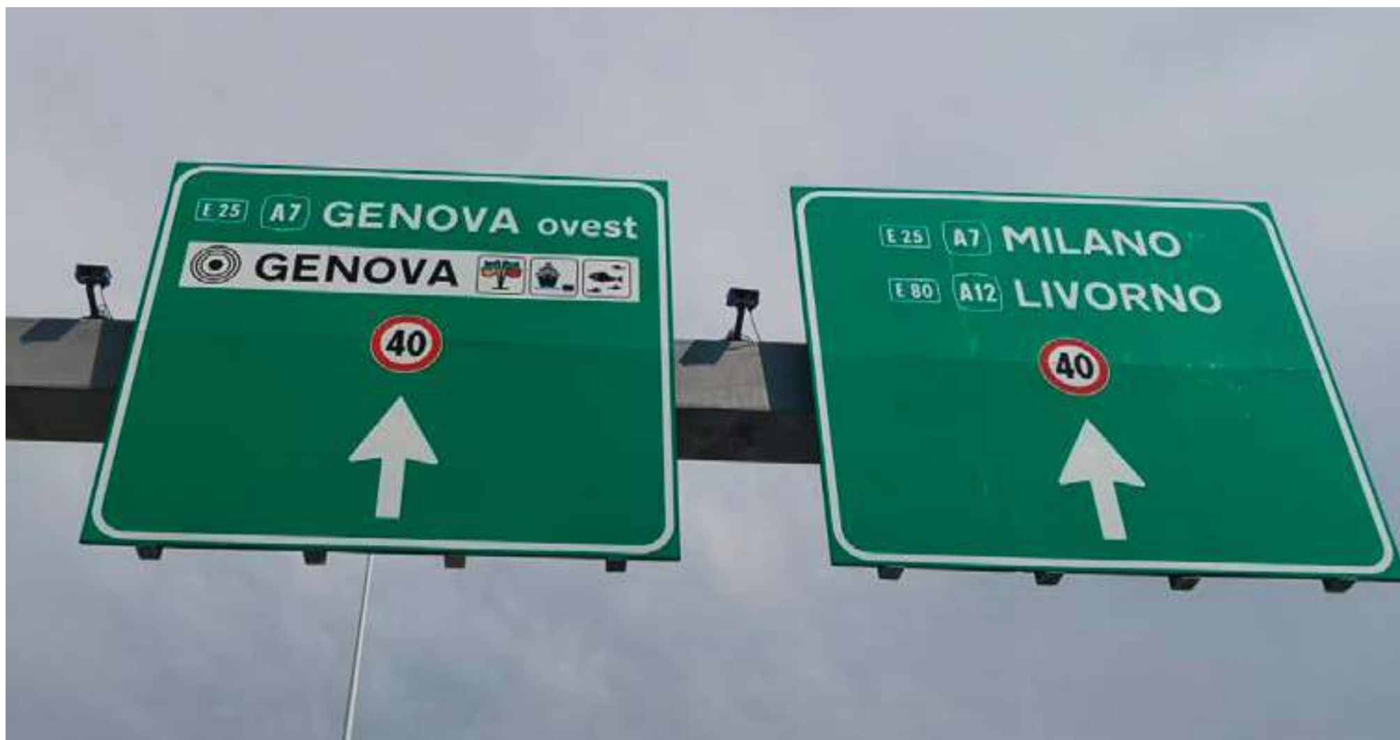
Telecamere a supporto del sistema "iWIM Bisonte" per l'individuazione dei veicoli.

Una struttura smart e green al tempo stesso, un'opera unica in Italia, un gioiello di tecnologia con un sistema intelligente di circa 250 sensori per monitorare la sicurezza, 4 robot per ispezione e pulizia, pannelli fotovoltaici, impianti di deumidificazione e illuminazione e un sistema integrato SCADA finalizzato al controllo, monitoraggio e supervisione di tutti gli impianti tecnologici a servizio dell'infrastruttura