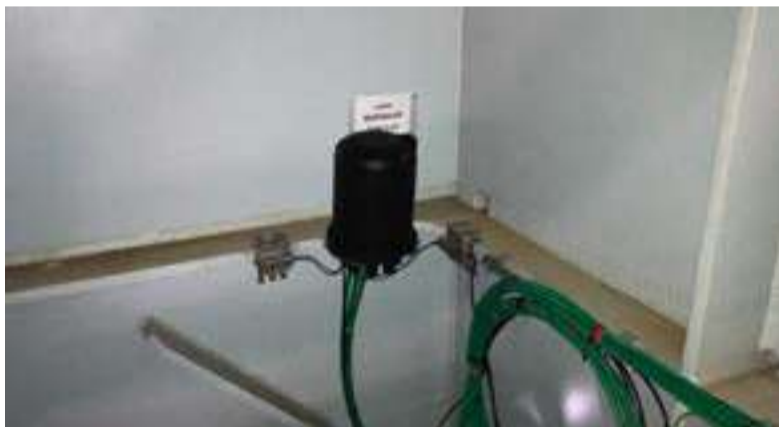
Accelerometri per monitoraggio dinamico e vibrazionale dell'impalcato metallico (immagine fornita da CETENA).

In aggiunta alla sensoristica più propriamente strutturale, sono stati installati a inizio, fine e metà ponte, tre anemometri a ultrasuoni per misurare l'incidenza del vento, una centralina meteo e, nell'impalcato, 30 sensori di temperatura per valutare correttamente le entità di deformazioni e spostamenti relativi in funzione delle condizioni termiche dell'impalcato. Il software del sistema di monitoraggio analizza in modo olistico tutti i dati per determinare il comportamento globale del ponte. "A completamento del sistema – precisa Cusano – un sistema iWIM Bisonte costituito da otto piastre di pesatura dinami-