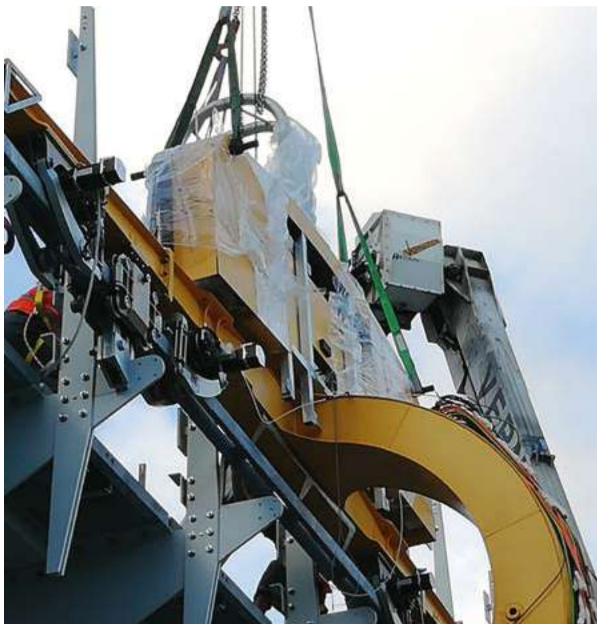
Particolare dell'aggancio del braccio meccanico del robot-inspection alla parte esterna del ponte percorsa da rotaia.