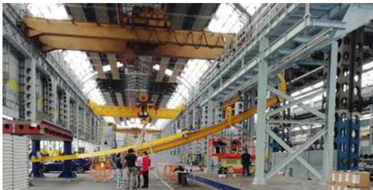
Braccio meccanico estensibile del robot-inspection.