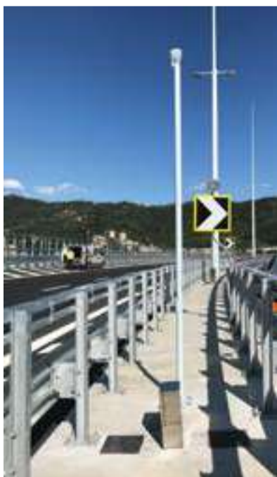
Anemometri a ultrasuoni per misurare l'incidenza del vento, collocati a inizio, fine e metà ponte.