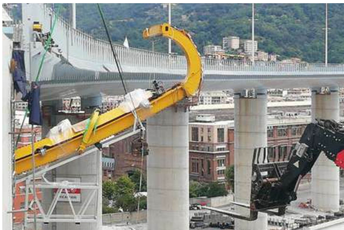
Posizionamento del braccio meccanico del robot-inspection (immagine fornita da IIT - Camozzi).