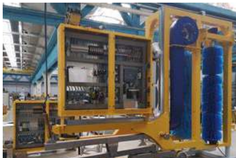
Dettaglio del robot-wash.

"Grazie alla mecatronica cognitiva - spiega Cannella - i robot saranno capaci di interpretare gli input dei sensori esterni e avranno nozione dell'ambiente circostante per valutare autonomamente i livelli delle batterie necessarie per l'alimentazione della strumentazione che montano, decidere quando entrare in azione, in quale direzione muoversi in base al vento, per consumare meno energia, valutare dove si trovano gli altri robot e dove sono le stazioni di ricarica più vicine, posizionate ogni qualche centinaio di metri e, nel caso dei robot-wash, quando utilizzare l'acqua piovana o quella di condensazione, oppure usare una soffiante nei periodi secchi". Il sistema dovrebbe quindi garantire un minimo intervento da parte dell'uomo nel corso della vita utile della struttura. È minima anche la gestione del robot, grazie appunto a questa tipologia di controllo, che rende il sistema robusto e affidabile. Inoltre, "il sistema è aperto, sia a livello hardware che software, a nuove tecnologie in quanto è già da considerarsi come una piattaforma di studio, sia per l'aggiornamento dei sistemi di monitoraggio, sia per la sperimentazione di nuove tecniche e soluzioni, che trasformeranno la struttura in un vero e proprio laboratorio a cielo aperto", conclude Cannella.